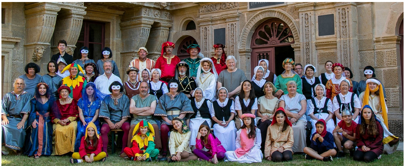
La troupe costumée

Le groupe théâtre de Chalindrey, né en 1967, demeure la seule troupe cheminote sur le comité Est. Il présente des spectacles renouvelés tous les deux, trois ans, lors de tournées dans le sud haut-marnais et même au-delà, ceci sans interruption depuis sa création. De nombreux festivals nationaux du théâtre cheminote se sont déroulés à Chalindrey, le dernier ayant eu lieu en 2011.