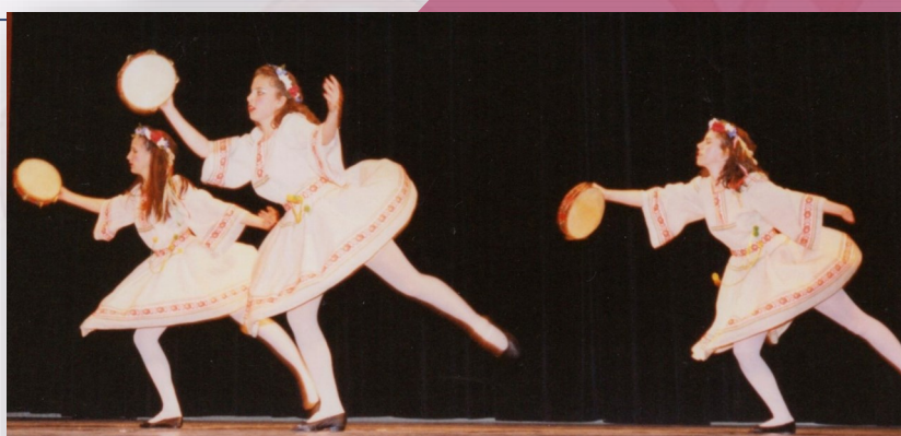
Rythmes et Danses

Harry Belafonte : chanteur, acteur et militant des droits civiques américain (1927-2023)