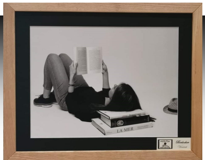
La lecture (Vincent Berlocher)