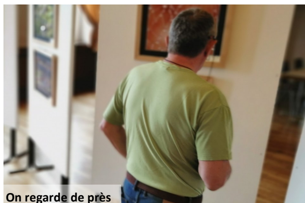
On regarde de près

Ainsi, durant deux jours, les visiteurs ont pu découvrir l'univers de ces thèmes, que ce soit le monde végétal ou animal, le métal, le textile, la fibre et le plastique. Quant au cinéma, le public découvrirait parmi les photos : un ancien projecteur, une bobine de film, un ancien