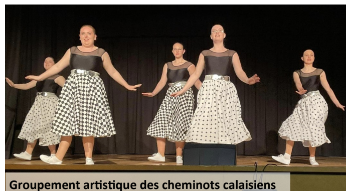
Groupement artistique des cheminots calaisiens