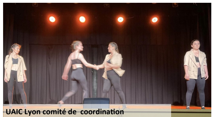
UAIC Lyon comité de coordination