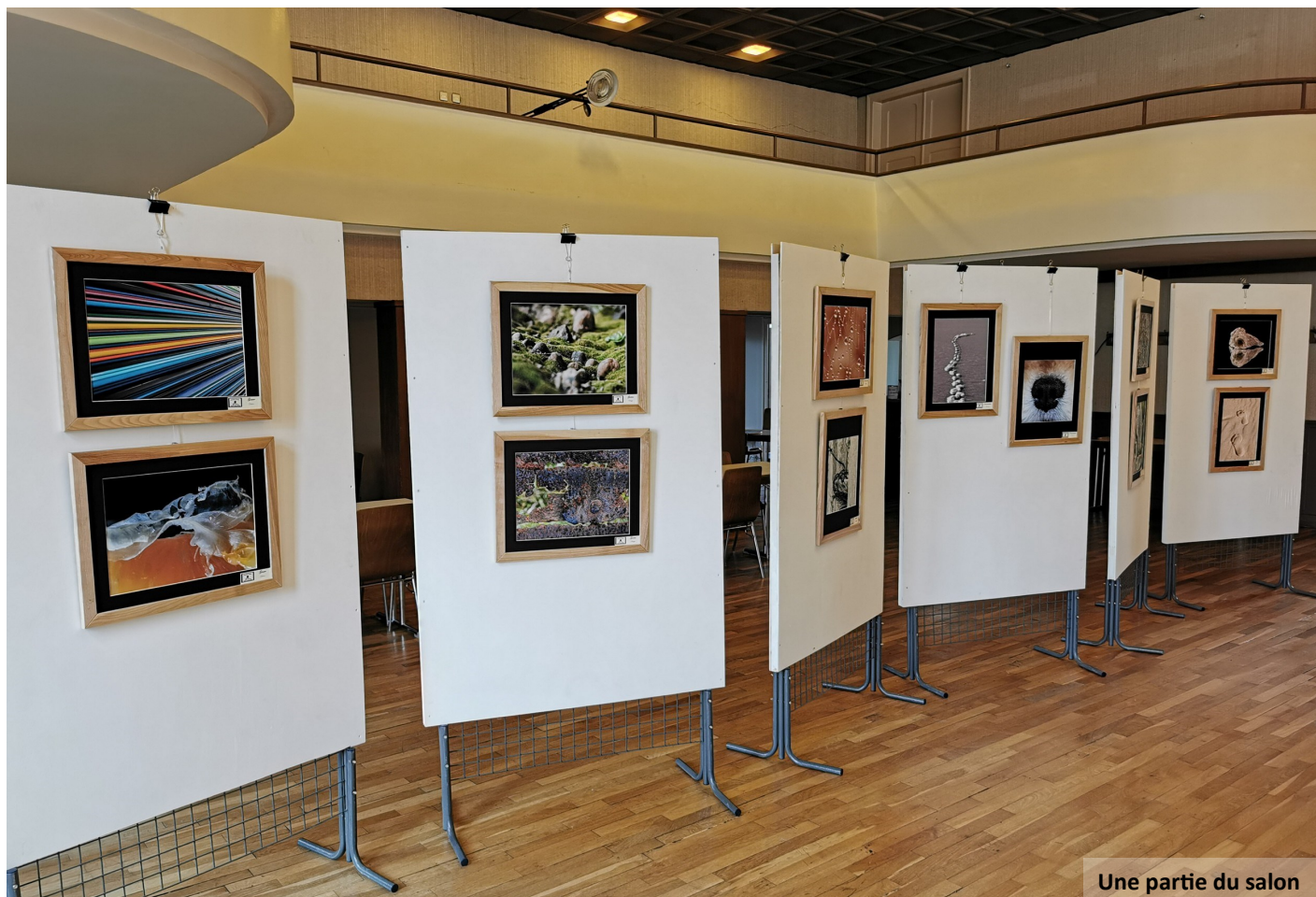
Une partie du salon