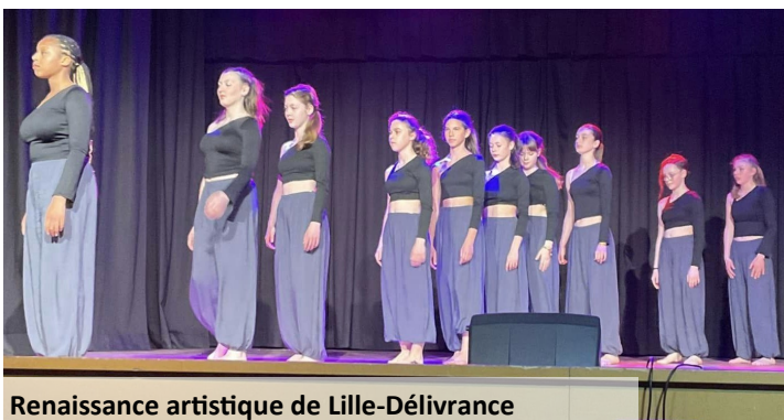
Renaissance artistique de Lille-Délivrance