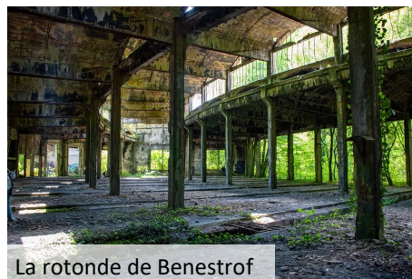
La rotonde de Benestrof

tin, une séance photographique dans la rotonde abandonnée et une autre, l'après-midi, à l'étang de Lindre à Lindre-Basse.