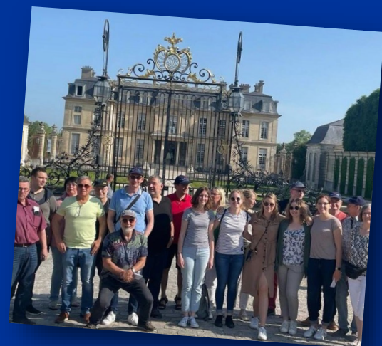
Le BOW devant le château

De 1939 à 1974, le château est utilisé pour la réception de chefs d'État étrangers. Depuis 1974, le domaine est ouvert au public. Allez découvrir le château de Champs-sur-Marne en déambulant à votre rythme dans le monument et dans son parc de 85 hectares.