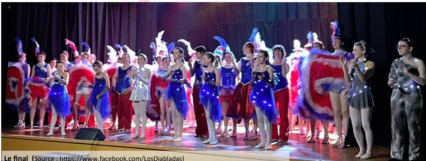
Le final

Une association a été invitée : Précieuse et Cie de Saint-Julien-les-Villas près de Troyes qui a débuté le spectacle avec une danse orientale