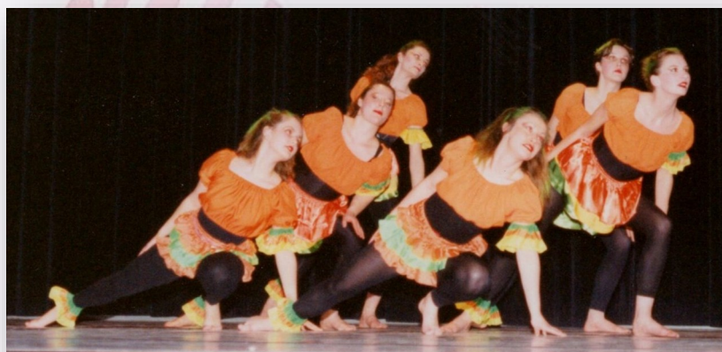
Le Foyer de Romilly

Le programme commença avec Le foyer de Romilly et son ballet Ange et démon sur une musique d'Enigma. Parmi les premiers ballets, on peut citer Katenka , danse du folklore russe (Dynamic-Club), En avant pour le jazz sur des airs des Pasadenas (GAAR), Allegro avec Mozart (Rythmes et danses - Noisy-le-Sec).