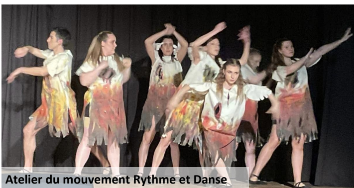
Atelier du mouvement Rythme et Danse