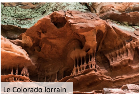
Le Colorado lorrain

Avant leur arrivée, ils ont été interceptés à la frontière dans le village de Roppeviller. Après avoir partagé le pique-nique, une marche photographique les attendait le long du Colorado lorrain. C'est un très joli site de plusieurs centaines de mètres où l'on découvre des rochers de grès des Vosges travaillés par la nature.