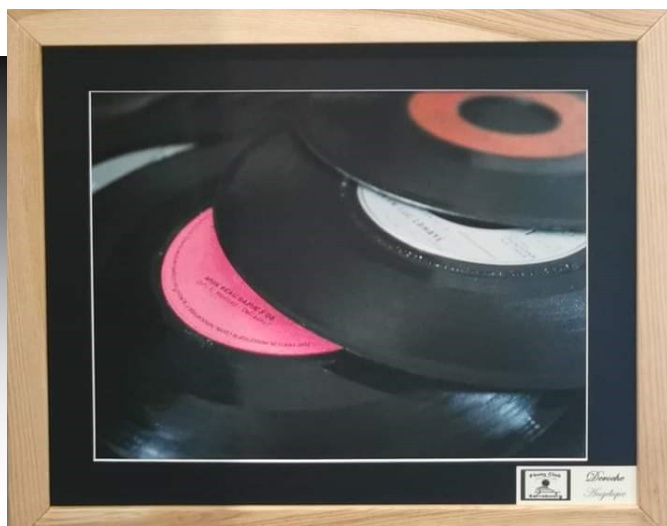
Vinyle (Angélique Deroche)