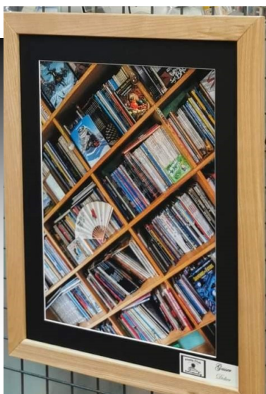
Bibliothèque (Philippe Guérin)