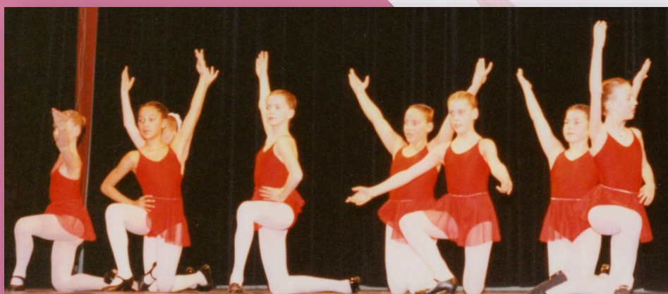
Dynamic Club du rail

Enigma : projet musical allemand de new age , mêlant chants grégoriens et pop music, créé en 1990 par le compositeur d'origine roumaine Michael Cretu.