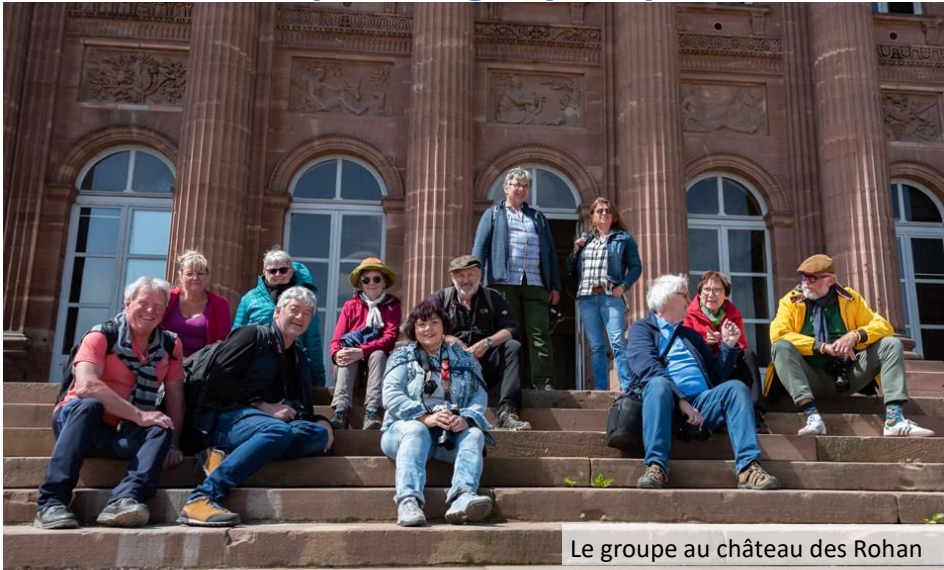
Le groupe au château des Rohan

Pour cette cinquième rencontre des photographes de la Deutsche Bahn BSW Fotogruppe d'Aschaffenburg et de leurs collègues de la SNCF du Photo-club UAICF de Sarrebourg, le rendez-vous était fixé à Sarrebourg. Les membres du club ont concocté un programme photographique chargé.