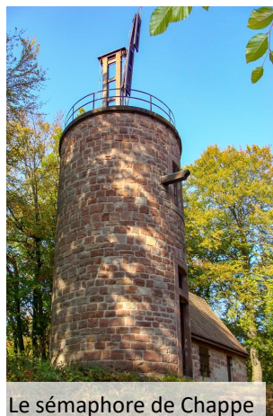
Le sémaphore de Chappe