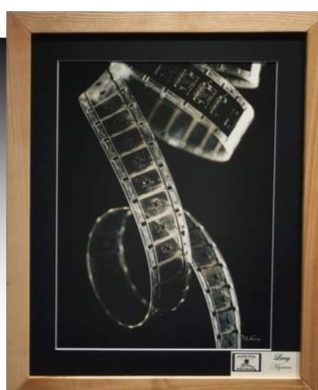
Bobines (Myriam Lang)