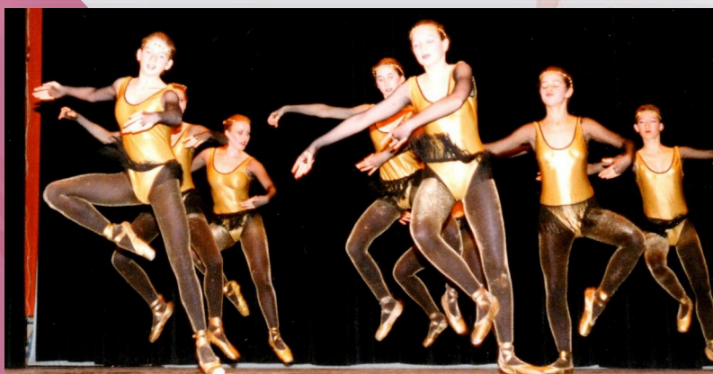
Groupe artistique Arthur Rimbaud

Quatre associations ont participé à ce rassemblement : le GAAR, le Dynamic-club de Léroville (disparu), le Foyer de Romilly et Rythmes et danses de Paris-Est (maintenant Studiorail). Elles ont présenté treize ballets, allant du moderne au classique en passant par le jazz et le folklore russe, soit un peu plus d'une heure de spectacle.