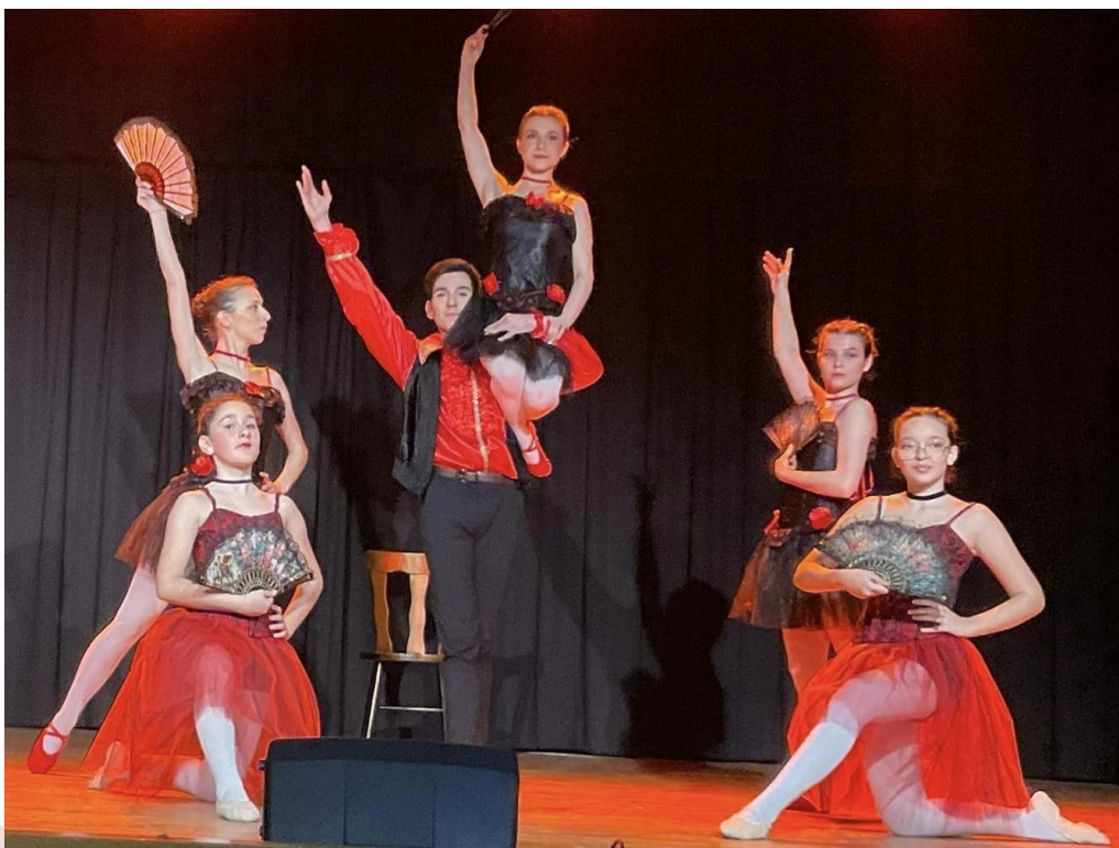
Atelier du mouvement Rythme et Danse

Un grand merci à la mairie pour le prêt de la salle. Merci à tous les bénévoles, sans qui le festival ne pourrait exister ainsi qu'à la technique son et lumières. Merci au CASI de Paris-Est et à la Mutuelle Entraînement pour leur contribution.