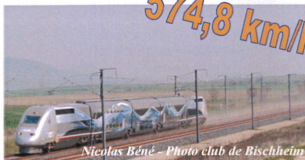
Nicolas Béné - Photo club de Bischheim

Record après record avec l'amour du métier de cheminot, la culture participe à graver par la photographie, la musique ou encore la danse cet événement qu'envie le monde entier.