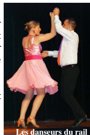
Les danseurs du rail