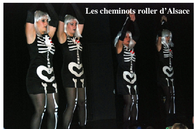
Les cheminots roller d'Alsace