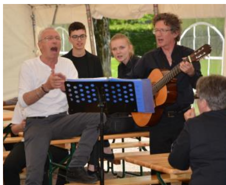
A la fête de l'amitié, on chante au dessert

La journée était placée sous le signe de la convivialité, avec les repas pris ensemble sous la grande tente dressée pour l'occasion. C'est devenu une tradition : les musiciens de Langres, au dessert, ont lancé des chants que les convives ont repris avec cœur dans un grand chœur improvisé !