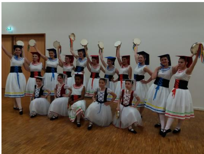
A l'occasion du festival national de danse les 8 et 9 juin 2019 à Dijon

Niccolò Paganini (1782 Gênes – 1840 Nice) violoniste, guitariste et compositeur réputé italien souvent qualifié de plus grand violoniste de tous les temps.