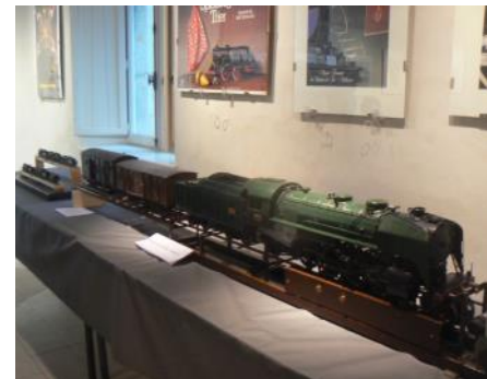
La maquette sifflant d'une machine à vapeur Un particulier de Bourgaltruff