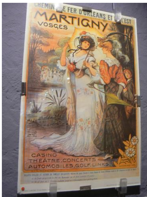
Affiche du chemin de fer d'Orléans et de l'Est - Musée lorrain des cheminots

Les 24 et 25 novembre et les 1 er et 2 décembre 2018, à la Maison du Bailli de Morhange en Moselle a eu lieu une exposition organisée par le Cercle d'histoire et du patrimoine de Morhange et environs.