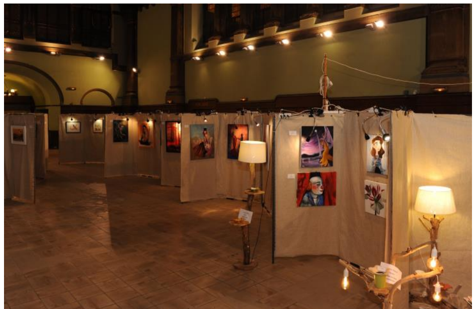
Vue d'ensemble de l'exposition de décembre 2018 en gare de Metz

Rappelons simplement que le salon propose un thème libre et un thème ferroviaire et qu'il réserve aussi une place aux jeunes artistes de moins de 18 ans dans ces deux thèmes. Merci de propager dans votre entourage ce futur événement.