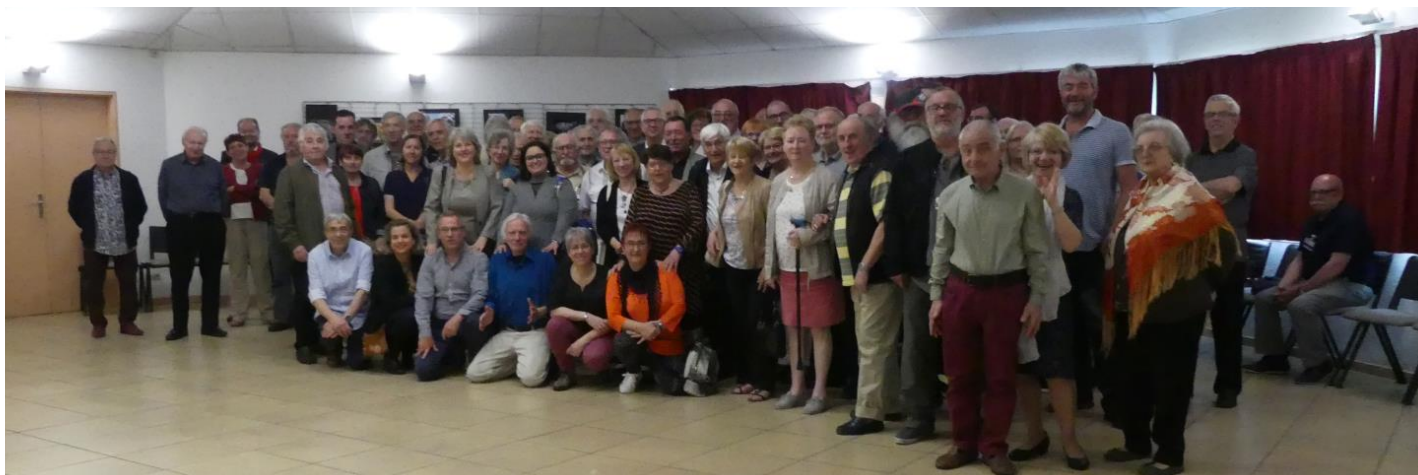
Les participants lors de l'assemblée générale

L'essor du chemin de fer et l'effort de mise en valeur routier sous les différents régimes politiques français accentuent la mutation de la ville d'Obernai en ville de manufactures, tout en amenant une grande prospérité bourgeoise. Annexée, comme le reste de l'Alsace, par l'Allemagne en