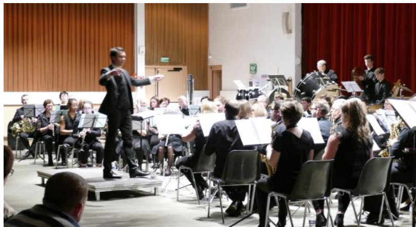
L'harmonie de Chenôve (Côte d'or)