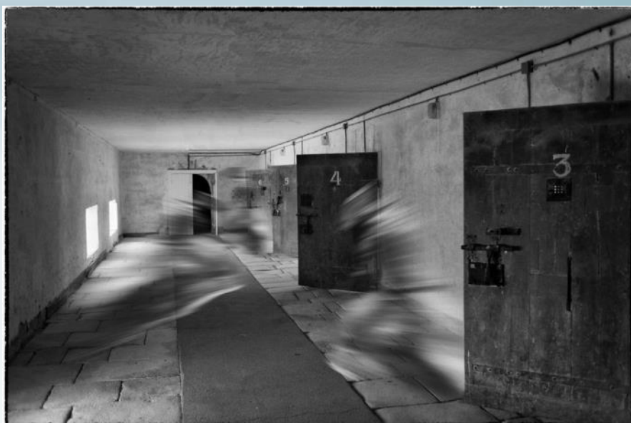
Photo monochrome Prison Chalindrey