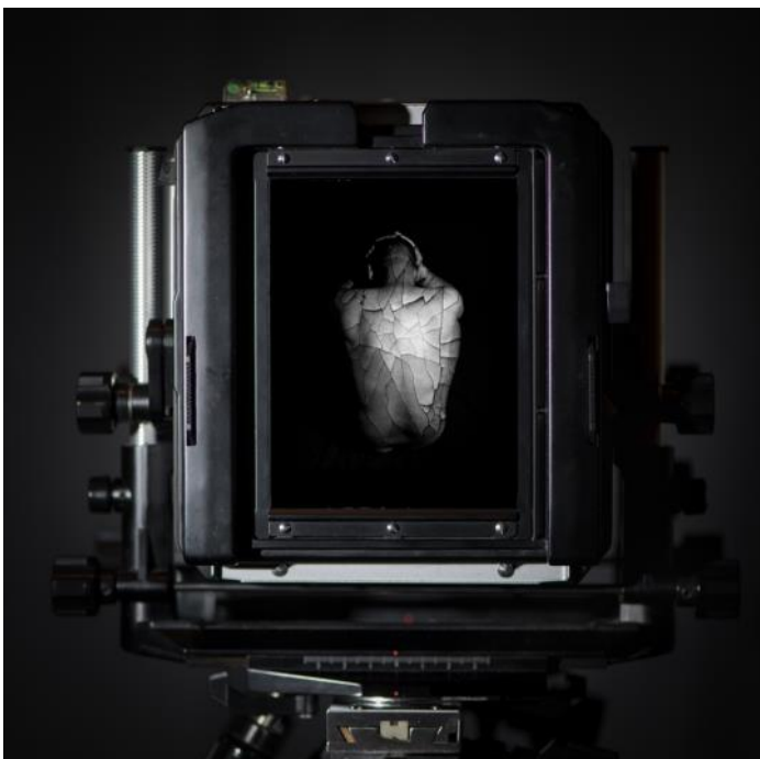
Chambre photo par Frédéric Bouchahda

Theodor Scheimpflug (1865 - 1911) capitaine dans l'armée autrichienne, s'intéresse à la photographie. Il est pionnier dans la cartographie par photographies aériennes et invente une méthode pour redresser les perspectives afin de pouvoir créer des cartes à partir de ses clichés.