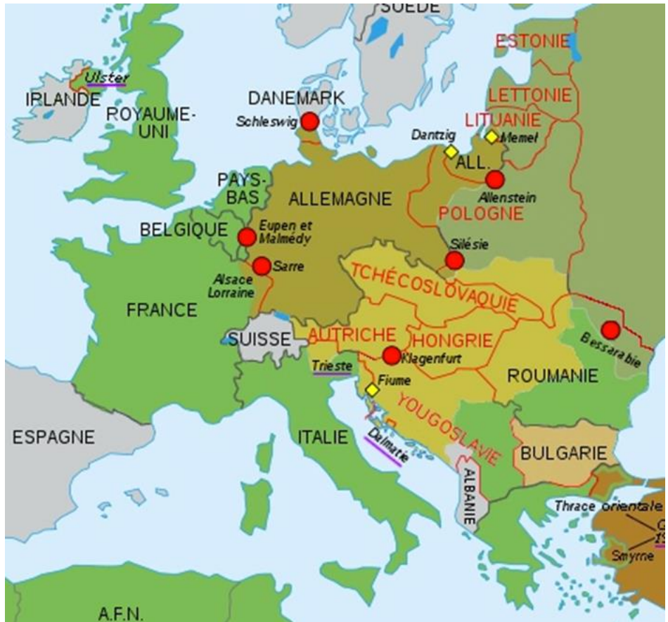
L'Europe en 1923 (frontières en rouge)

La Belgique annexe quelques villes frontalières. Le Danemark récupère des territoires perdus en 1864 après la guerre contre l'Autriche et la Prusse. La rive gauche du Rhin est démilitarisée et mise sous surveillance. La Sarre, riche en charbon, est placée sous administration internationale pendant 15 ans.