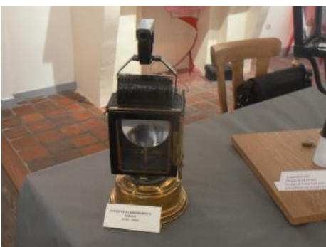
Lanterne à carbure multi-service (1938-1960) Musée lorrain des cheminots