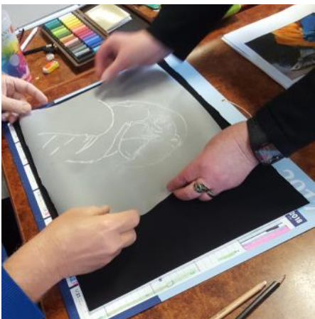
Transfert du sujet sur le papier velours