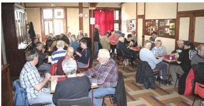
La salle du tournoi (salle de la section loisirs)

Le 11 mai 2019, la section loisirs du Foyer de Romilly organisait son concours de tarot. Comme chaque année le succès était au rendez-vous puisque 48 joueurs s'étaient inscrits pour en découdre.