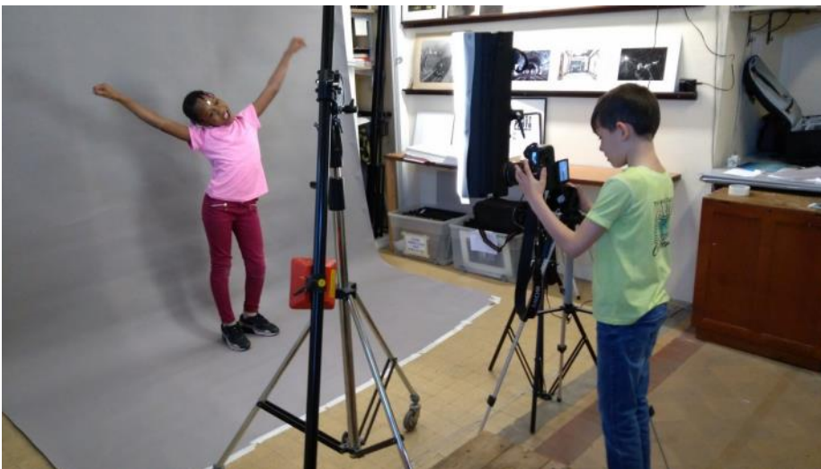
Les élèves font des prises de vue