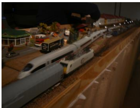
Maquette de la gare de Forbach Le Petit Train de l'Est