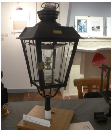
Lampadaire Est (1859 - 1964) Musée lorrain des cheminots