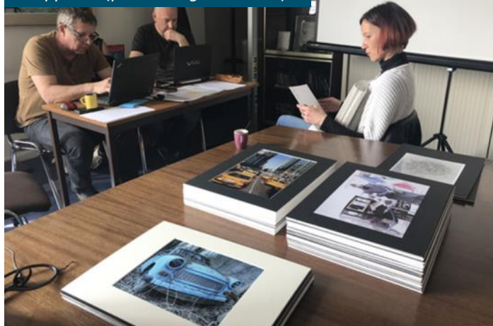
On apprécie