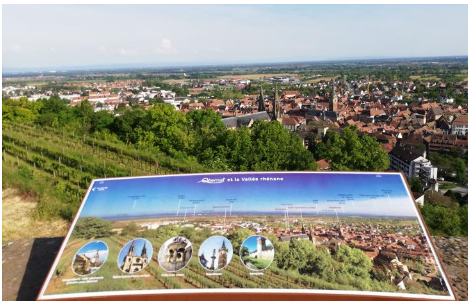
Vue du Mémorial National d'Obernai - photo : Philippe Délespaux

A 25 km au sud-ouest de Strasbourg et à 25 km au nord de Sélestat, région Grand Est, la ville d'Obernai est située dans la plaine d'Alsace, en bordure ou au piémont des Vosges (en allemand Oberehnheim composé de ober, Ehn et Heim, littéralement « ville en amont sur l'Ehn »). Établie à 181 m d'altitude, la gare est placée au point kilométrique (PK) 24,711 de la ligne Sélestat - Saverne entre les gares de Goxwiller et de Bischoffsheim. La station mise en service le 28 septembre 1864 par la Compagnie des chemins de fer de l'Est ouvre à l'exploitation le chemin de fer vicinal n°1 bis de Strasbourg à Barr.