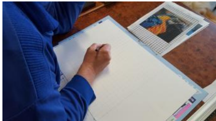
Méthode de la grille pour report et agrandissement du sujet