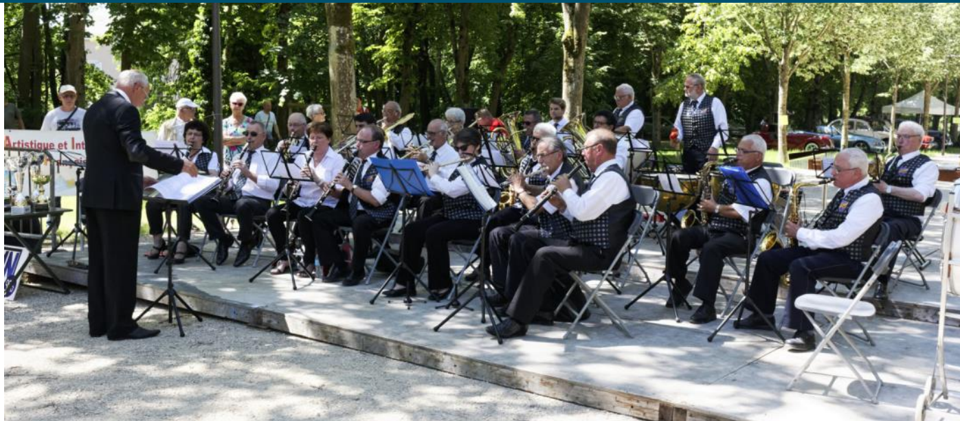
L'harmonie des chemins de fer de Romilly-sur-Seine