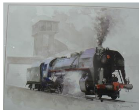
Aquarelle de Lucien Jouvencaux proposé par l'ADPFL