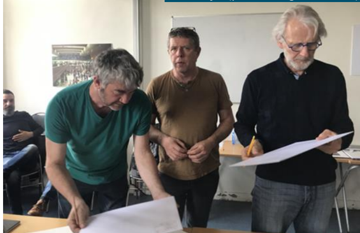
On vérifie