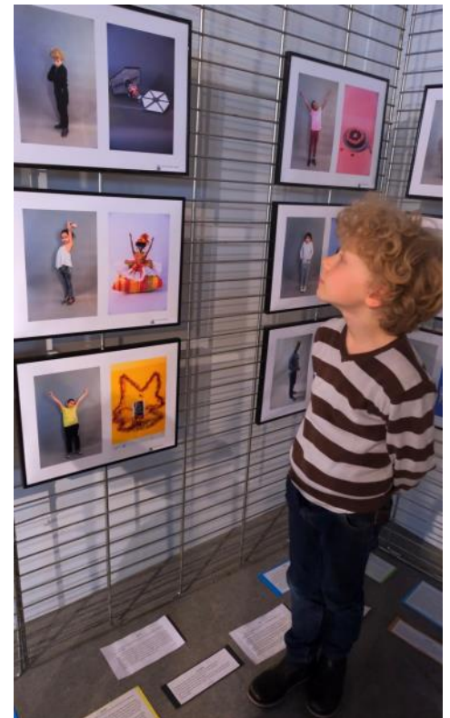
Devant son œuvre

Samedi 18 mai, inauguration avec plus de 300 personnes