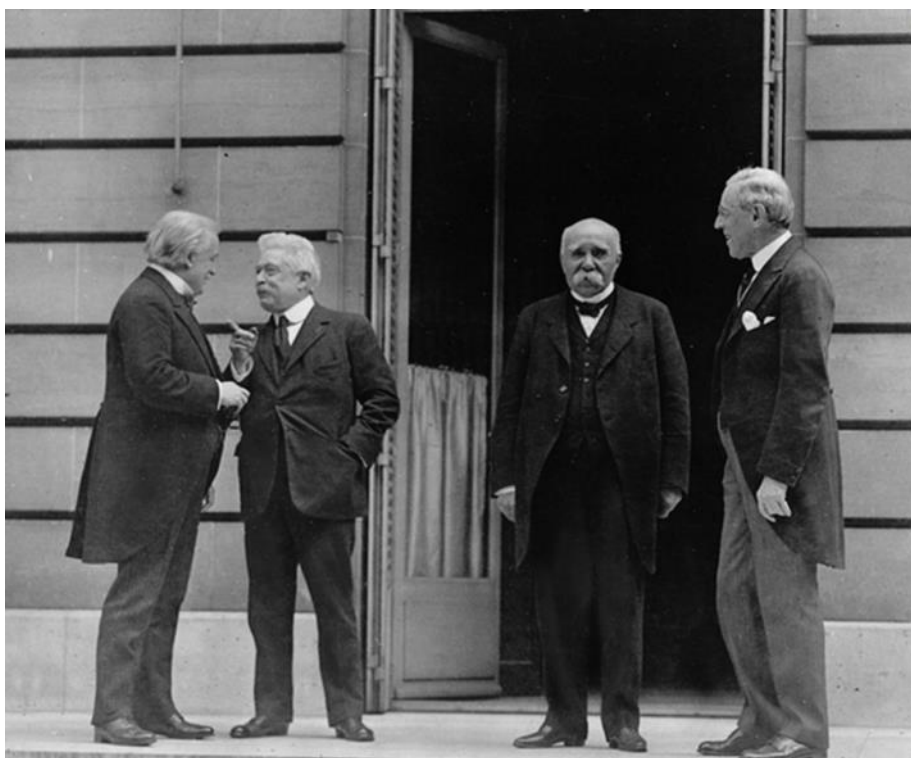
Le conseil des Quatre De gauche à droite, Lloyd George, Orlando, Clemenceau et Wilson.