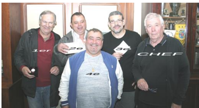
Les premiers du classement