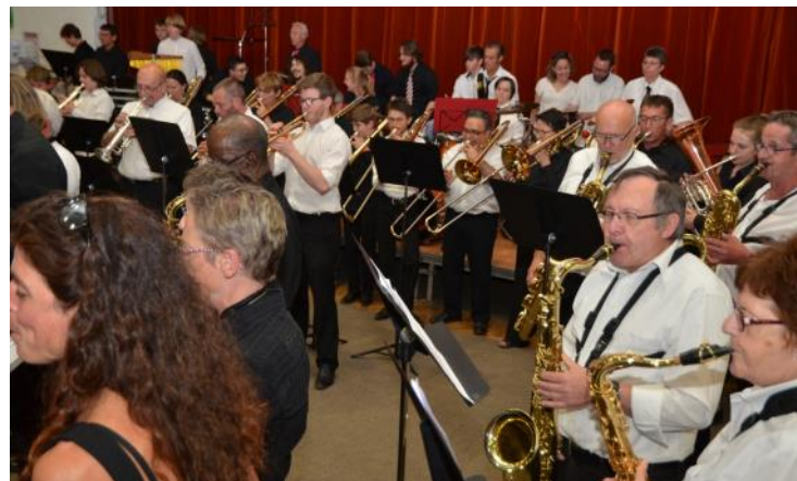
A la fête de l'amitié, on joue ensemble

La Lyre voyage très bien dans l'hexagone, à l'international, mais sait aussi recevoir. Cette année est d'ailleurs placée sous le signe de l'accueil et du partage.