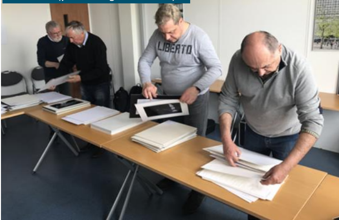
On classe