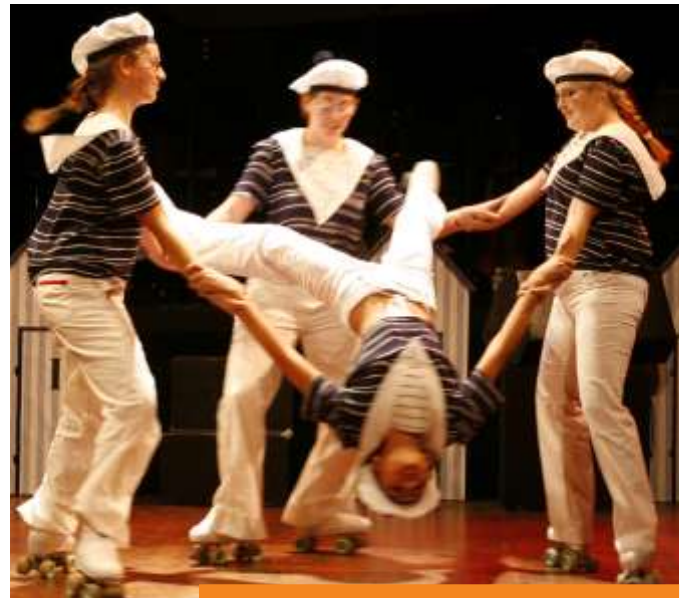
Les cheminots roller d'Alsace