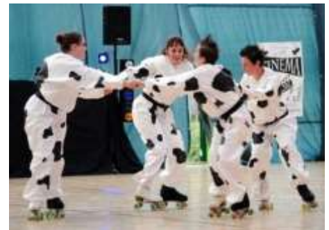
Les cheminots Roller d'Alsace