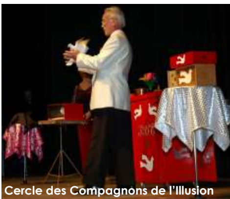
Cercle des Compagnons de l'illusion