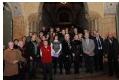
Le groupe des artistes du Salon 2014