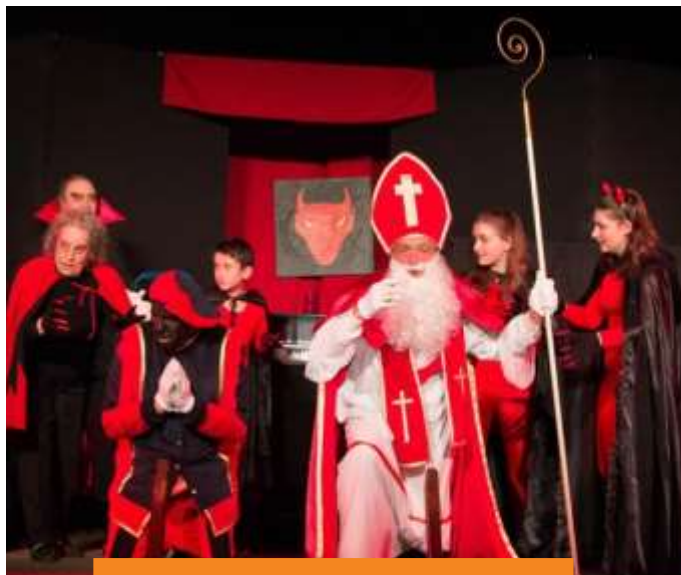
La légende de Saint-Nicolas