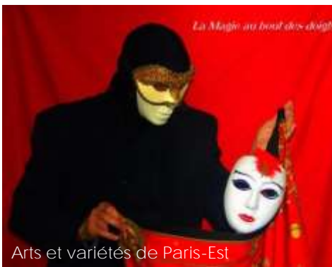
Arts et variétés de Paris-Est

Le Comité UAICF Est organise, avec la participation du photo-club de l'Association des Cheminots de Vesoul, le sixième festival régional de variétés.